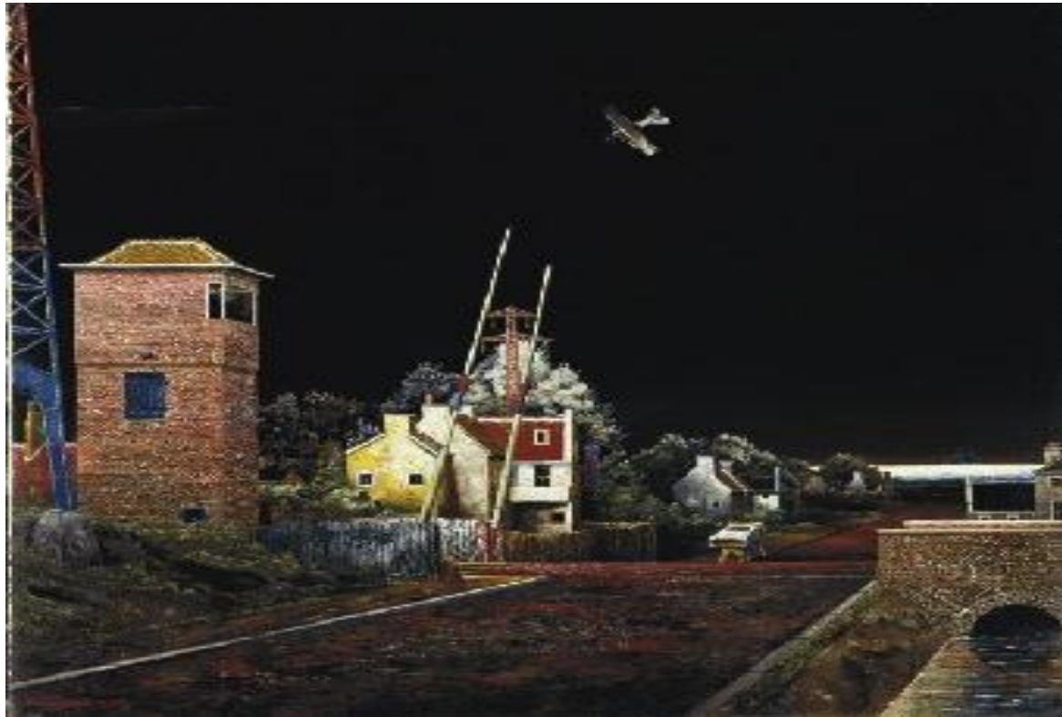
Franz Radziwill, Accidente fatal de Karl Buchstätter (1928).